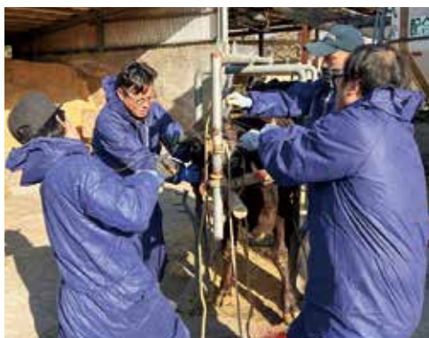
除角(じょかく)作業中

1月29日(木)畜産青年部・吾平総合支所・共済組合・JA関係者13名で、飼育農家21件を巡回し、37頭の除角作業が行われました。