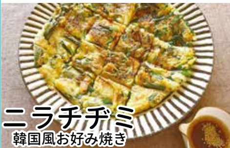
ニラチヂミ 韓国風お好み焼き