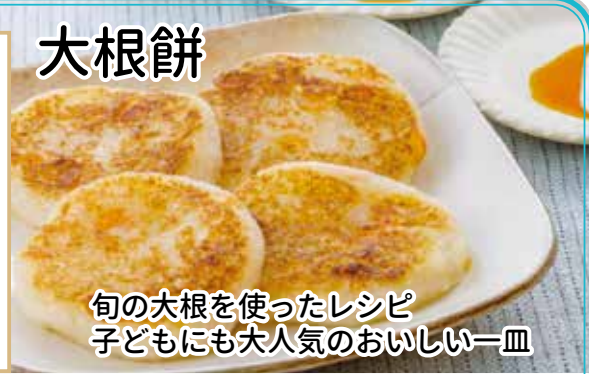
旬の大根を使ったレシピ 子どもにも大人気のおいしい一皿