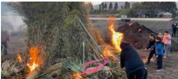
鶴峰東地区鬼火炊き

1月10日(土) 下名東町内会・1月17日(土) あいら川鬼火焚き・2月1日(日) 鶴峰東町内会では、正月明けの恒例行事鬼火焚きが開催されました。