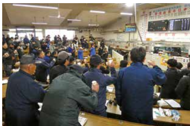
生産者・購買者・消費者へ献杯

セリ市会場では、「生産者・購買者・消費者」に敬意を表し、お茶で「献杯」がされ、2026年午年、勢いよく前へ進み、大きく飛躍できる一年にと活気あふれるセリ市で賑わいました。