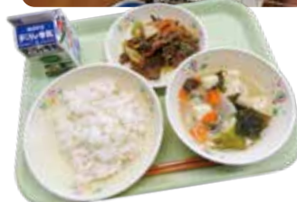
吾平町学校給食センター