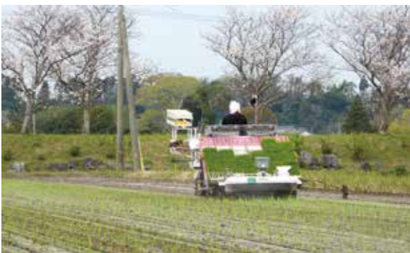
順調に生育しますように